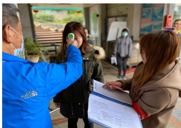
2. 警衛及導護老師進行體溫測量並記錄