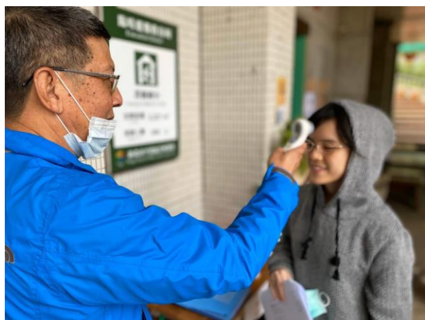
5. 學生測量額溫大於 37 度 C 者