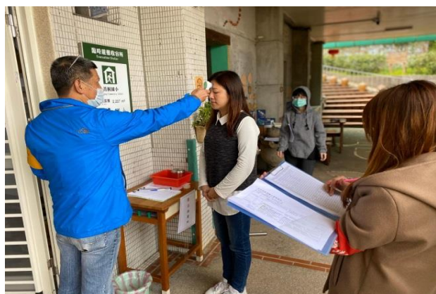
1. 學生及教職員統一從大門口進入