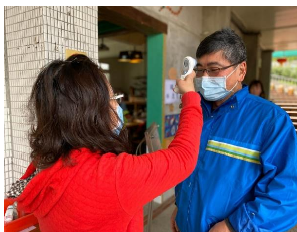
10. 學生家長至校，檢測體溫