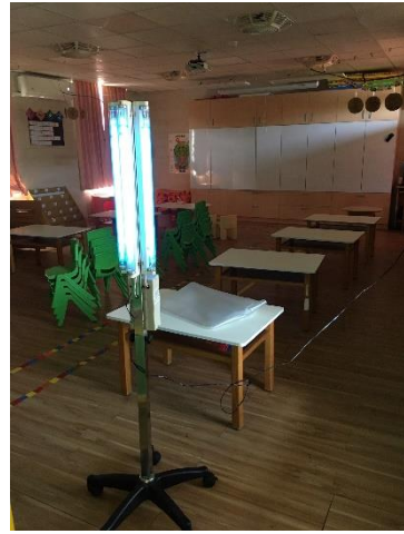
幼兒園教室進行紫外線消毒工作。