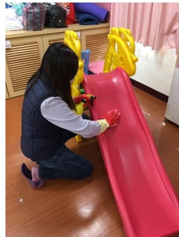
幼兒園主任進行遊樂器材消毒工作。