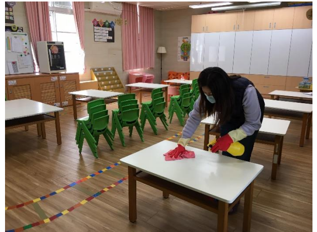
幼兒園主任進行學童課桌椅消毒