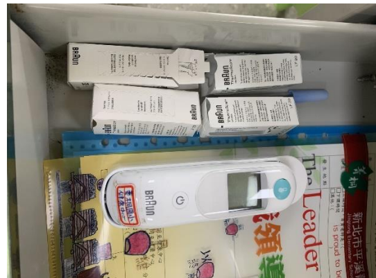
健康中心清點防疫物品準備開學後進行防疫工作-耳溫槍(另額溫槍採購中)。