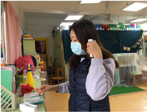
幼兒園主任進行耳溫槍量測檢查，確認耳溫槍是否正常。