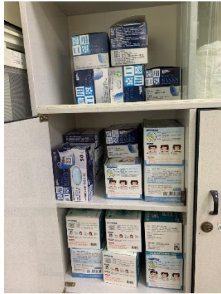
健康中心清點防疫物品準備開學後進行防疫工作-口罩。