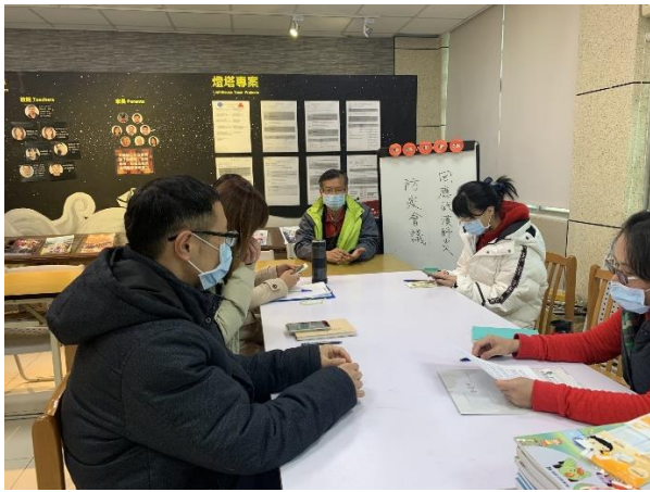
校長帶假親自返校召集行政同仁，召開因應武漢肺炎防疫會議。