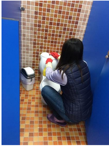
幼兒園主任進行廁所消毒工作。