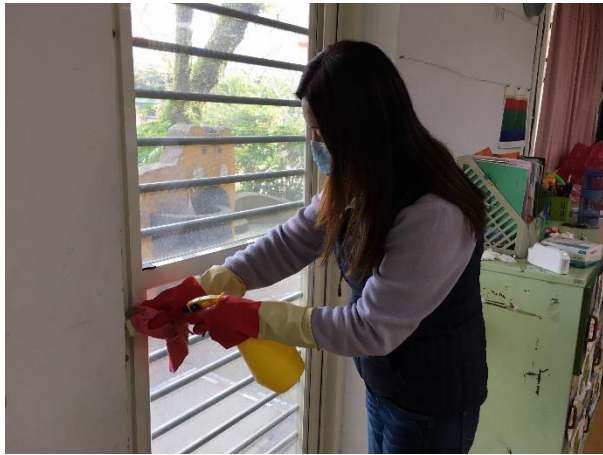
幼兒園主任進行門窗消毒工作。