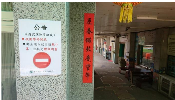
學校大門張貼告示，暫停校園開放，師生入校帶口罩及量測體溫。