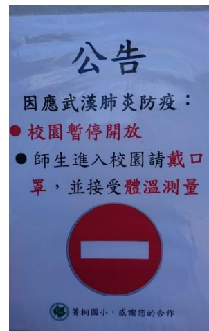
製作校園因應武漢肺炎告示。