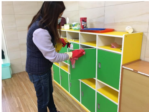
幼兒園主任進行櫥櫃消毒工作。