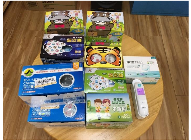
幼兒園防疫物品準備-耳溫槍及口罩。