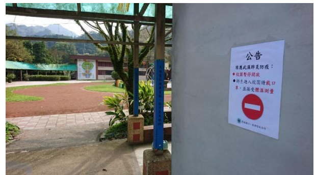
學校側門張貼告示，暫停校園開放，師生入校帶口罩及量測體溫。