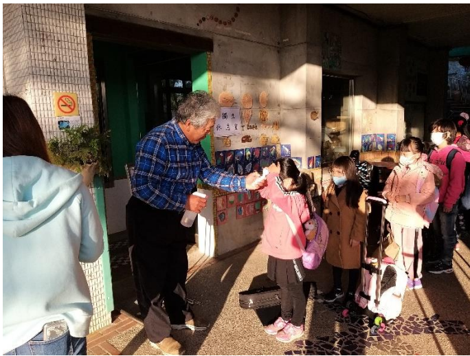
開學日小學體溫量測