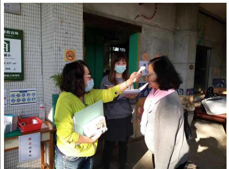
護理師協助教職員體溫量測