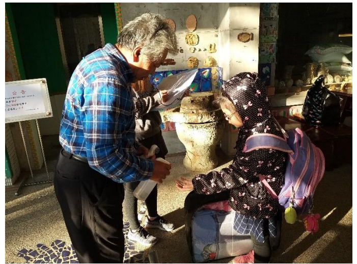
利用酒精進行手部消毒