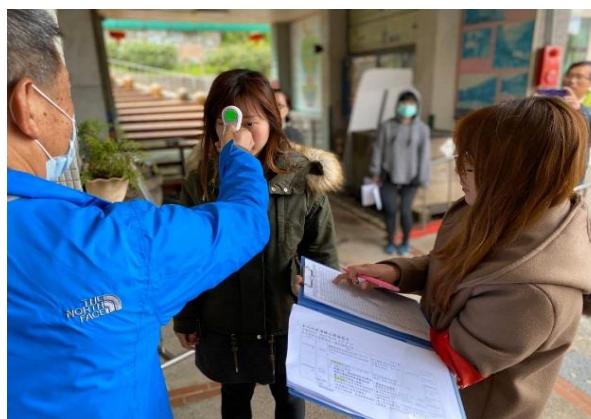
2. 警衛及導護老師進行體溫測量並記錄