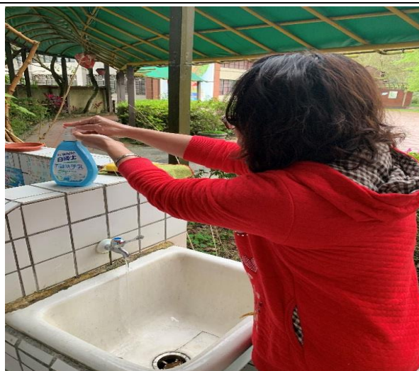
4. 確實洗手乳或肥皂洗手再入校