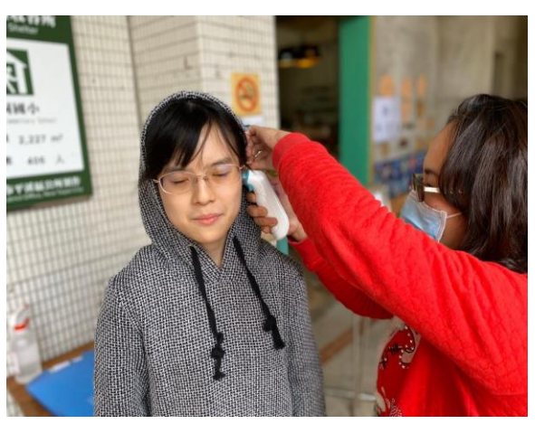
6. 護理師立即進行耳溫複查測量