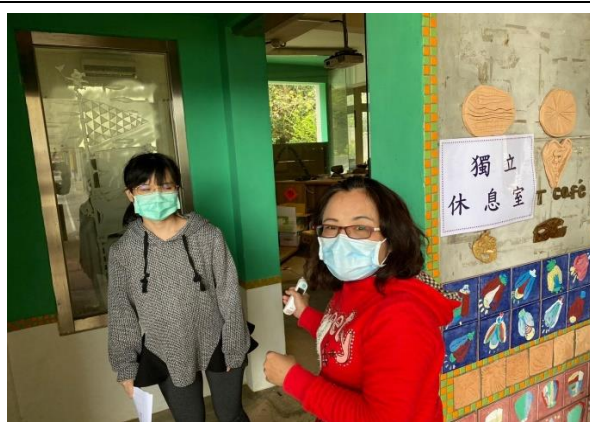
8. 帶至單獨隔離室隔離