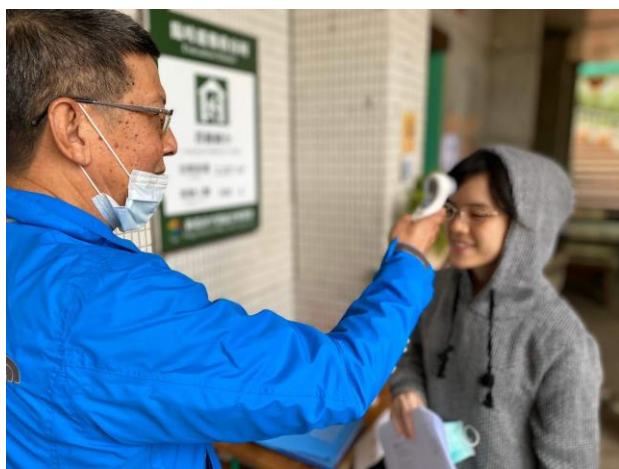
5. 學生測量額溫大於 37 度 C 者