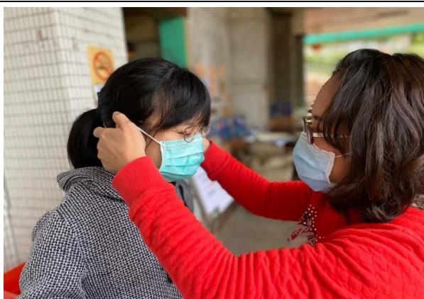
7. 耳溫複查大於 38 度者，予以戴上口罩