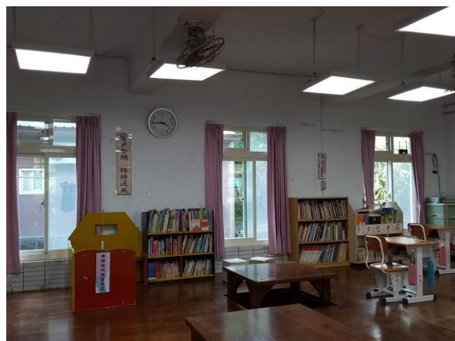
教室設置防疫標語