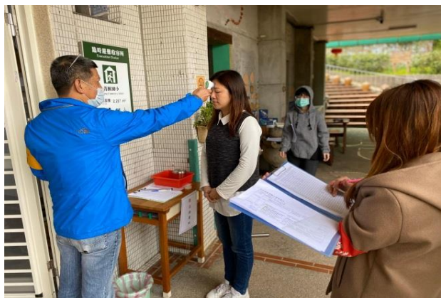
1. 學生及教職員統一從大門口進入