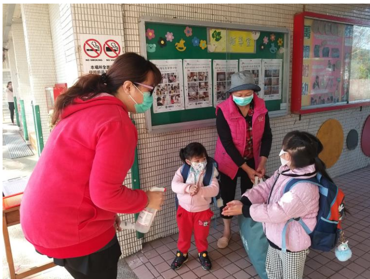
幼兒園體溫量測動線