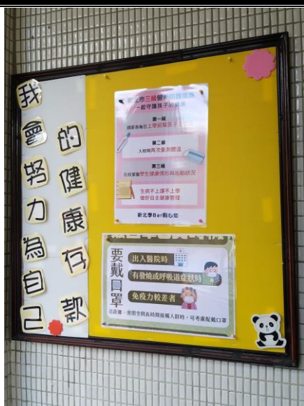
防疫衛教宣導公告欄