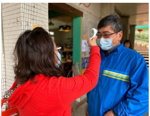
10. 學生家長至校，檢測體溫