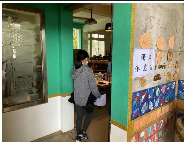
9. 等候家長帶回就醫